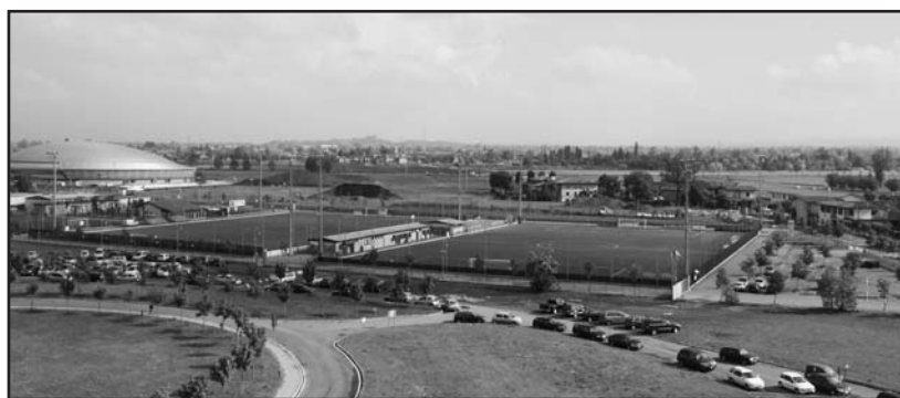
La struttura sportiva di Montichiarello.