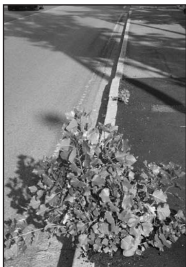
Piantumazione in via Mantova.

molta erba e addirittura con ceppugli. Al contrario abbiamo visto a Montichiari alcune aiuole ben tenute che facevano un bel vedere. Forse non è tutto oro quello che luccica, anzi si denota una situazione di lento ma inarrestabile degrado per gran parte del paese.