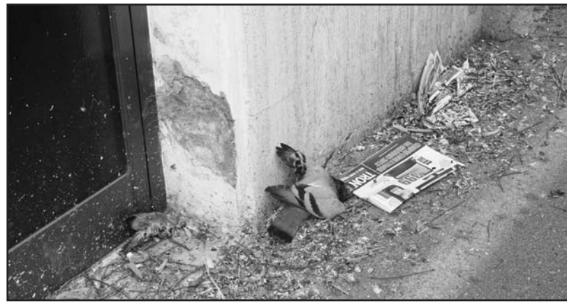
Una situazione igienica insostenibile.