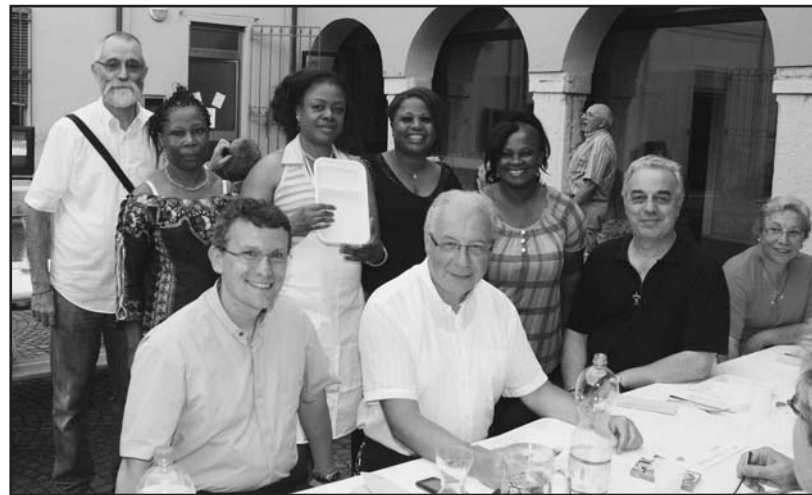
I responsabili ecclesiastici con le volontarie.

Particolarmente apprezzata la portata della "banana platano con pollo e pesce" tipica espressione della loro cultura. Le cinque nige-