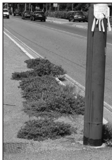
Un soffice prato.