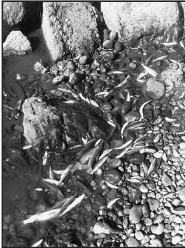
Nessun intervento delle autorità "per salvare" quintali di pesce del fiume Chiese in località Trampolino.

Ogni anno, stesso copione: in luglio e agosto, il Chiese è asciutto per mancanza di piogge, prelievi per irrigazione, necessità di livello minimo per il lago d'Idro. Come avviene all'italiana, c'è il solito rimpallo di responsabilità e, nonostante gli sforzi degli ambientalisti e di tutti quelli che amano la natura, siamo alle solite: corso d'acqua sempre più piccolo, acqua che non scorre più e il pesce che si trova a dibattersi nelle pozzanghere sempre più strette per l'evaporazione. Poi, forse una liberazione, arriva la morte per asfissia. Dice un signore, che abita in zona: "C'era una pozza d'acqua, sono venuti con la motopompa