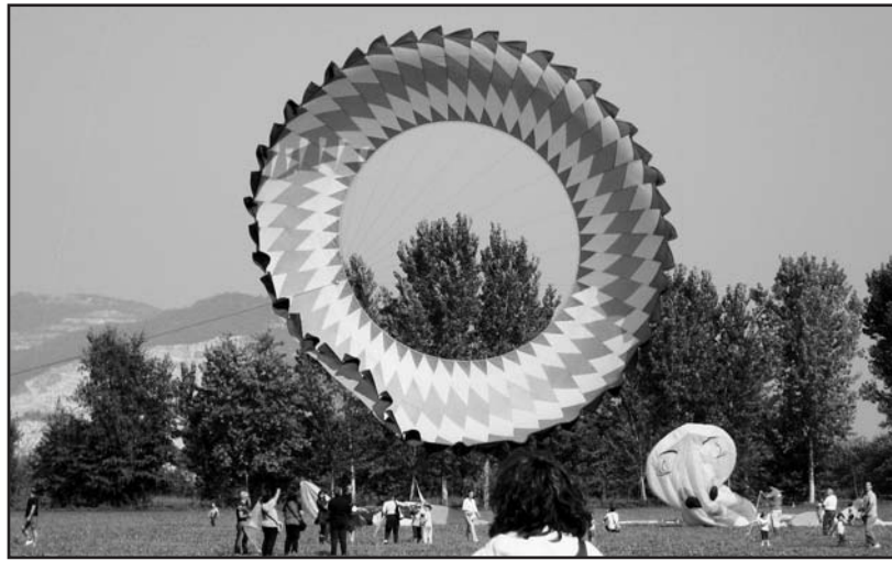
Lo spettacolo con gli aquiloni.

bambini che potranno costruire e poi disegnare il proprio aquilone e ...tante altre sorprese.