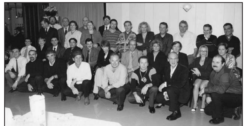
Una foto ricordo della classe '57.

Costo della gita, con pranzo a sacco è di 81.00 euro. All'atto dell'iscrizione versare la caparra di 30.00 euro di conferma. TELEFONARE 030.964482 - Gaetano orario negozio.