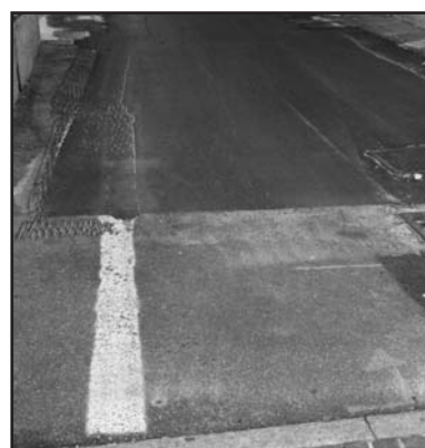
Sovrapposizione in via XXV Aprile.

A vevamo fatto presente, prima della sosta estiva, la curiosa segnaletica orizzontale in via A. Mazzoldi a Montichiari. Enormi frecce che